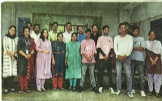
सोमेश्वर महाविद्यालय में हुए व्याख्यान कार्यक्रम में मौजूद विद्यार्थी।